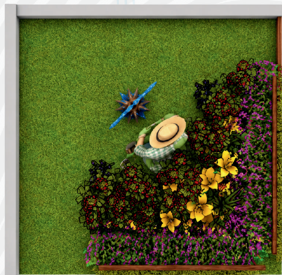
Planta Baixa Humanizada