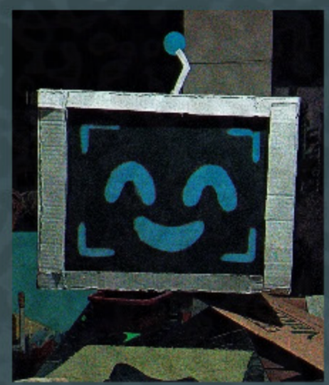
I.A.G.O DE PAPELÃO, EVA , tinta e uma bolinha