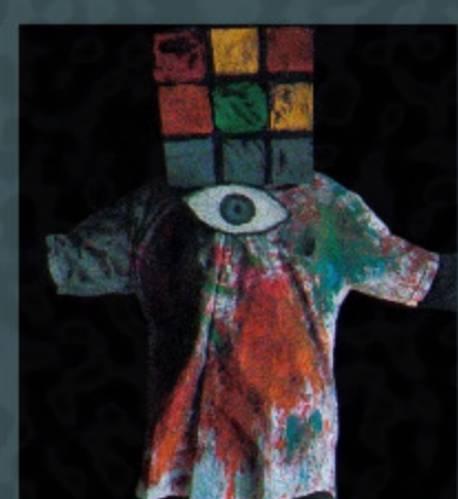
The creative a criatura do cubo