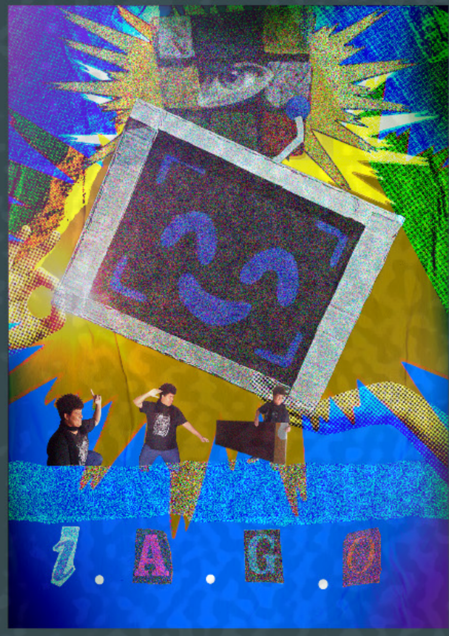
arte final com ruído de VHS aplicado, iluminação e estética analog horror, e o personagem mano Will