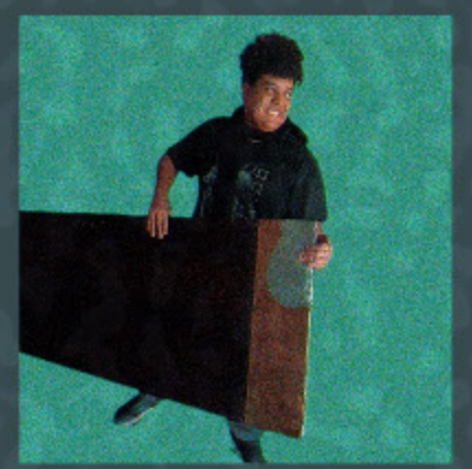
Mano Will personagem humano