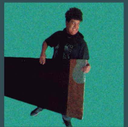
I.A.G.O DE PAPELÃO, EVA , tinta e uma bolinha