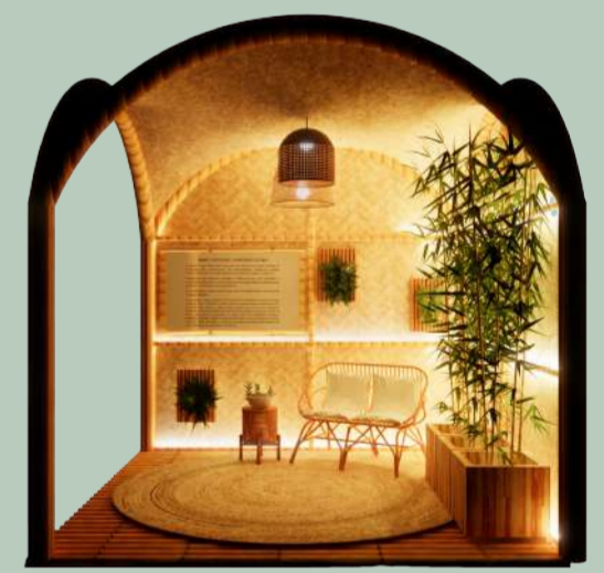
VISTA C - NOTURNA