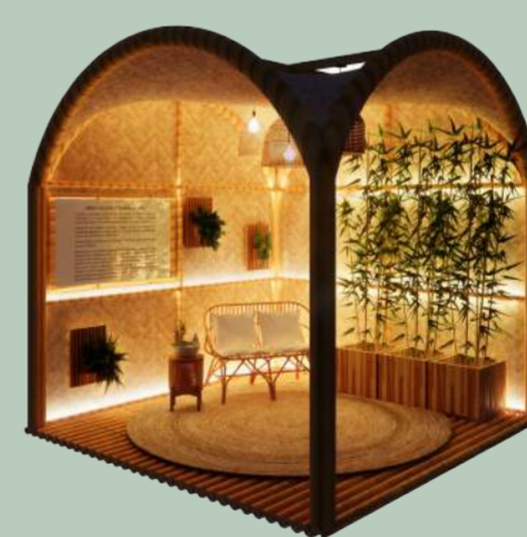
VISTA B - NOTURNA