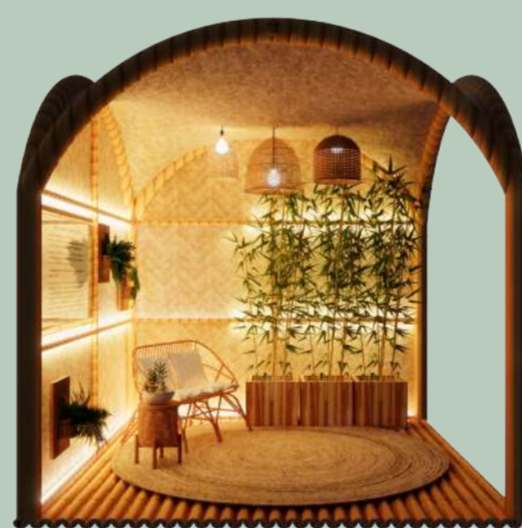
VISTA A - NOTURNA