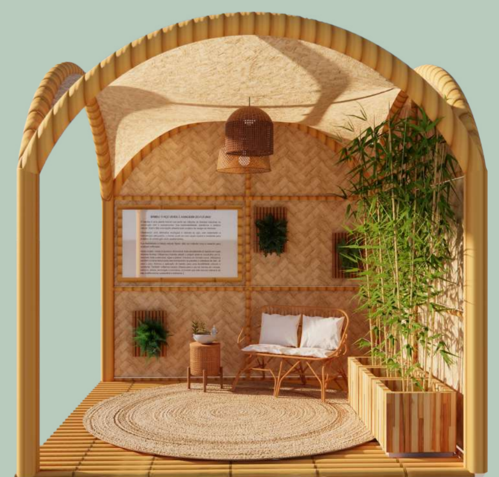
VISTA C - DIURNA