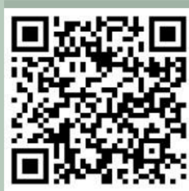
QR CODE - PASSEIO VIRTUAL