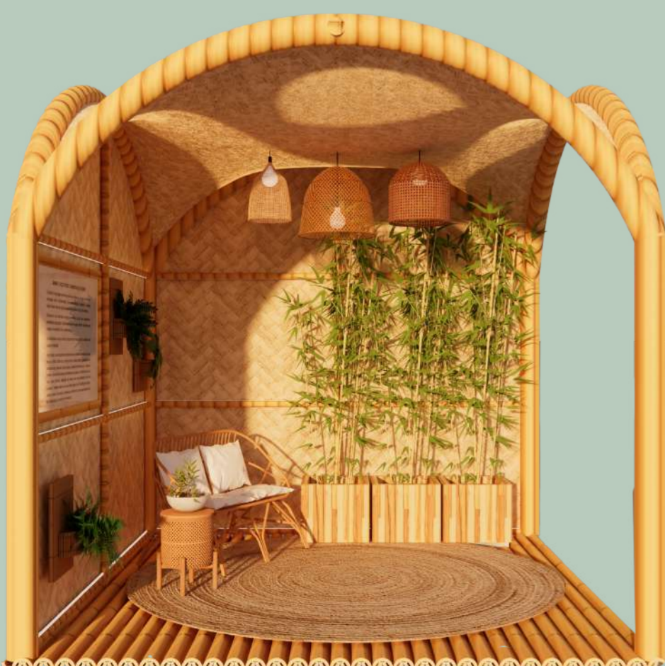
VISTA A - DIURNA