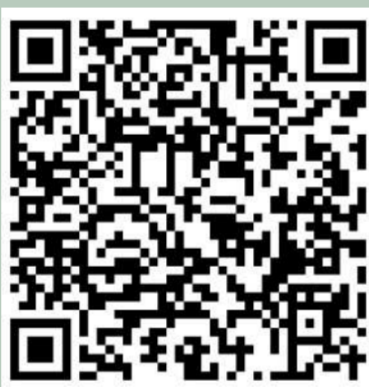
QR CODE - ARQUIVO SKETCHUP