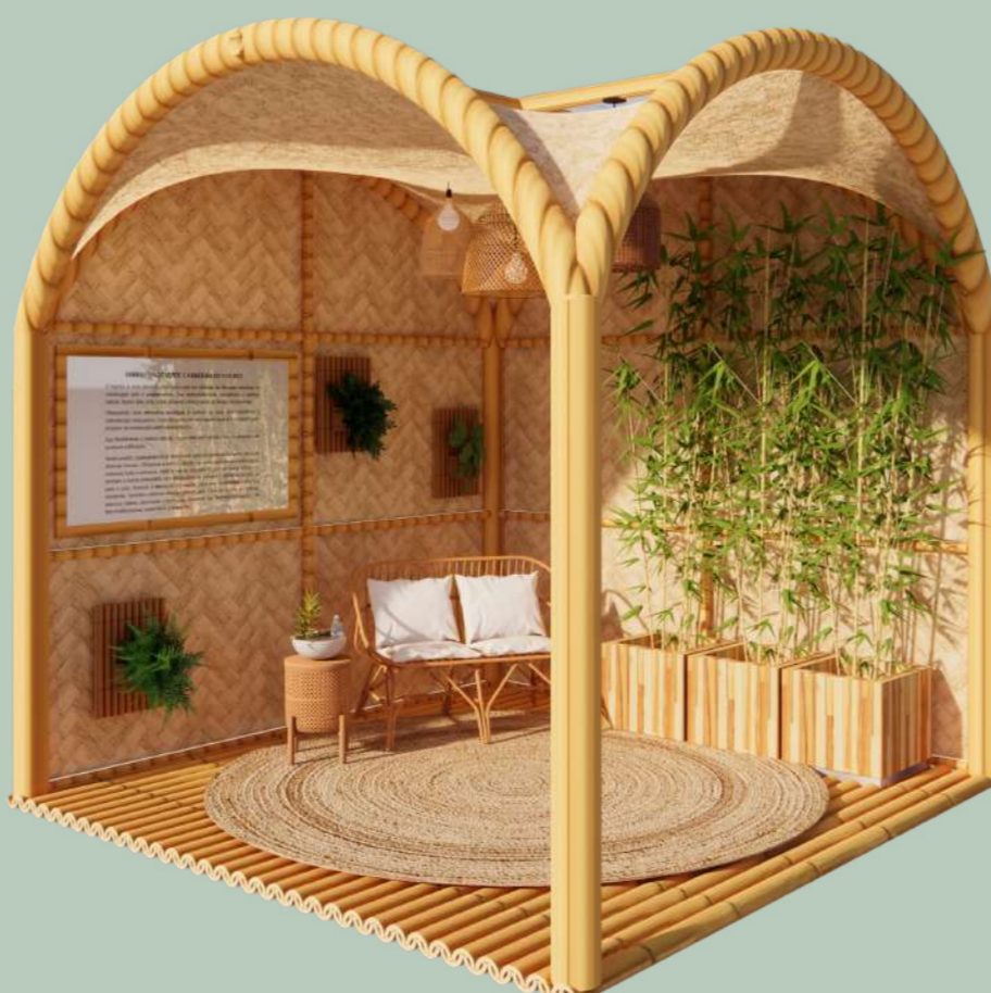
VISTA B - DIURNA