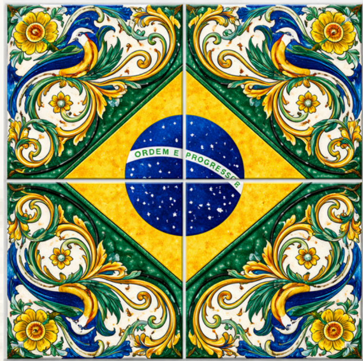
LADRILHO HIDRÁULICO AUTORAL

O que atravessa gerações sem perder o significado? Em mundo onde tecnologias evoluem, tendências se transformam e algoritmos moldam novas formas de viver, algumas experiências permanecem insubstituíveis. A fé, transmitida entre famílias, preservada na memória coletiva e enraizada na cultura de um povo, continua conectando passado, presente e futuro. A partir dessa reflexão, surge Casa Viva – A Fé Eterna, um espaço de contemplação inspirado em Nossa Senhora Aparecida que transforma símbolos de devoção, pertencimento e identidade brasileira em uma experiência sensorial capaz de celebrar aquilo que permanece essencialmente humano.