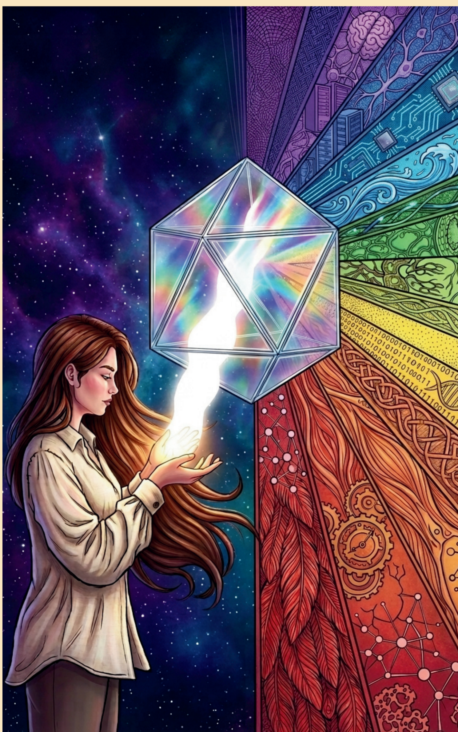
Figura 1: Arte final.

Inspirado no experimento de Isaac Newton com a decomposição da luz solar, o projeto utiliza de uma metáfora do prisma para discutir a Identidade Digital . Na arte, a luz branca que emana das mãos da personagem representa a essência e a criatividade humana e ao atravessar o prisma geométrico, essa “luz humana” se divide em um espectro de dados, onde algoritmos, redes neurais e texturas orgânicas coexistem de maneira fluida. Visualmente esta arte simboliza o que nos torna únicos e os padrões que nos mapeiam na rede.