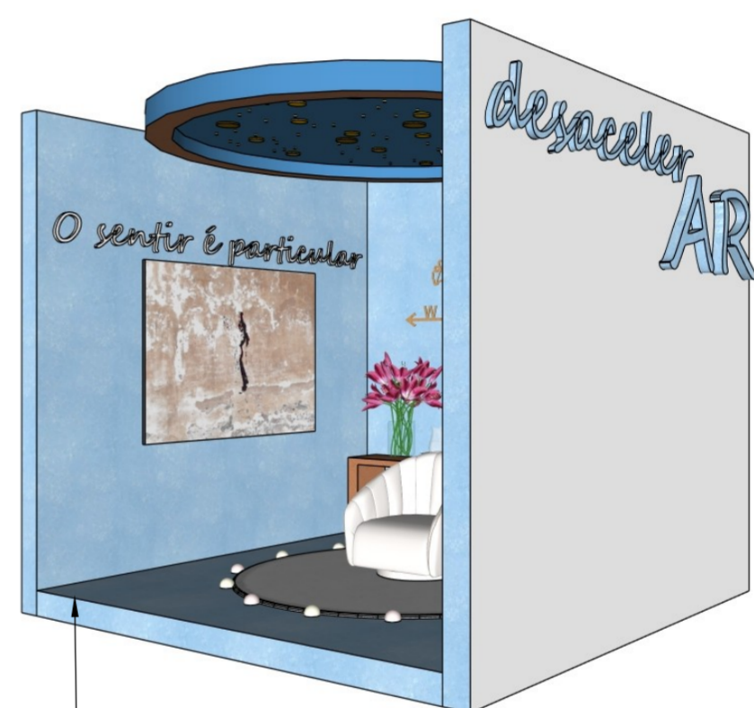
• Perspectiva lateral esquerda