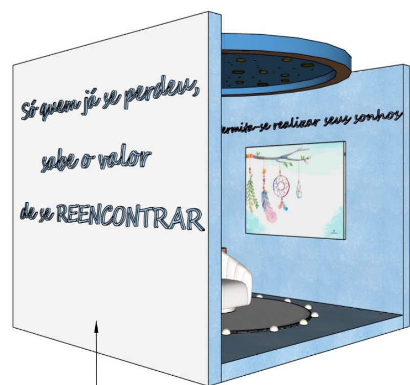
• Perspectiva lateral direita