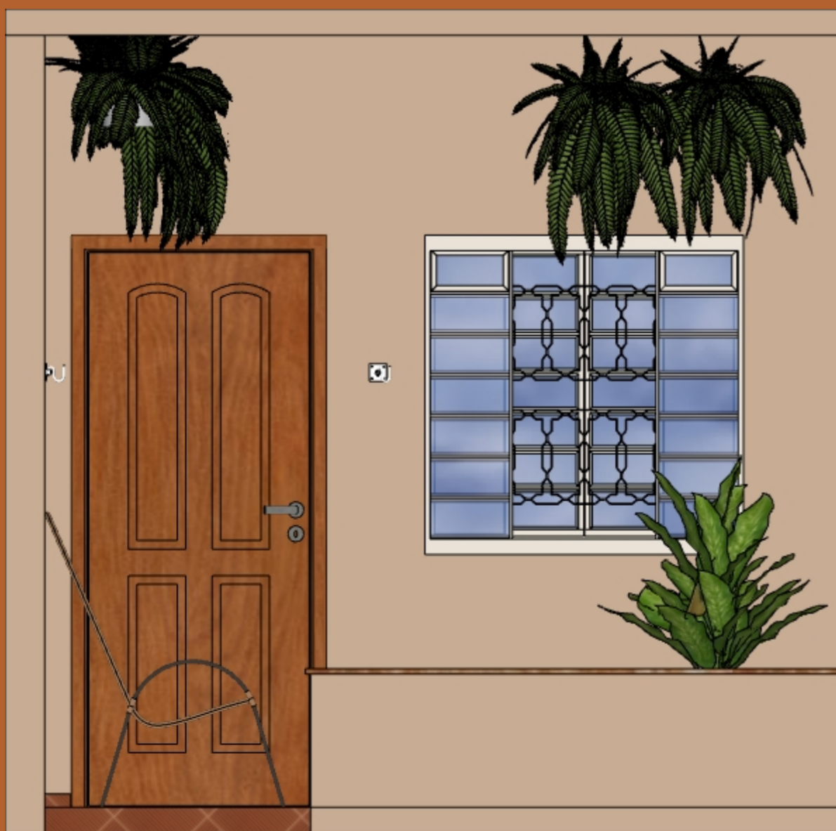
VISTA B ESCALA 1:20