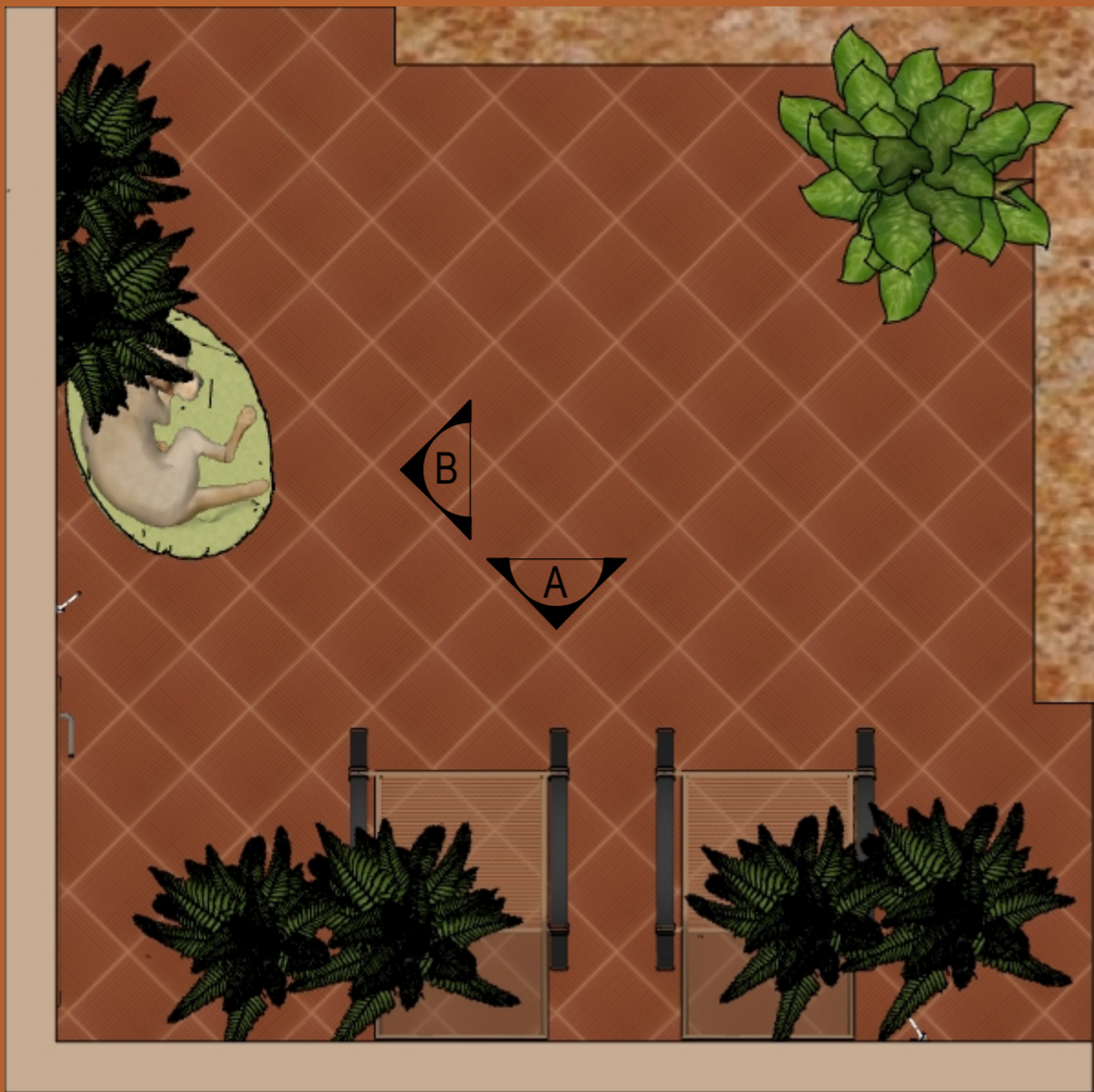
PLANTA BAIXA ESCALA 1:20