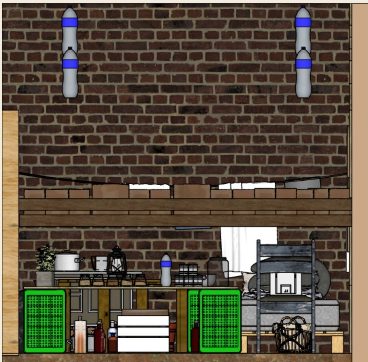
VISTA B ESCALA 1:20