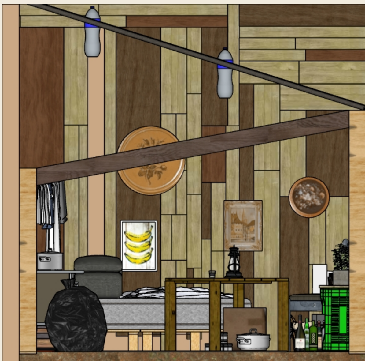
VISTA A ESCALA 1:20