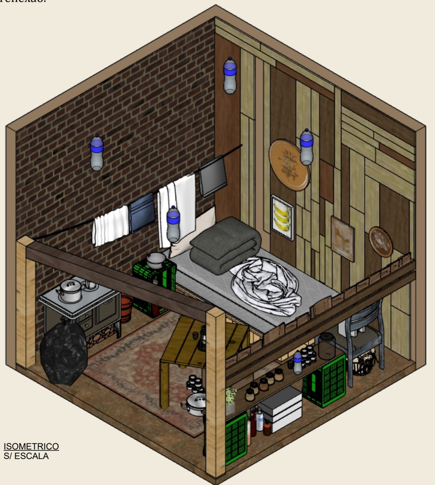
ISOMETRICO S/ ESCALA