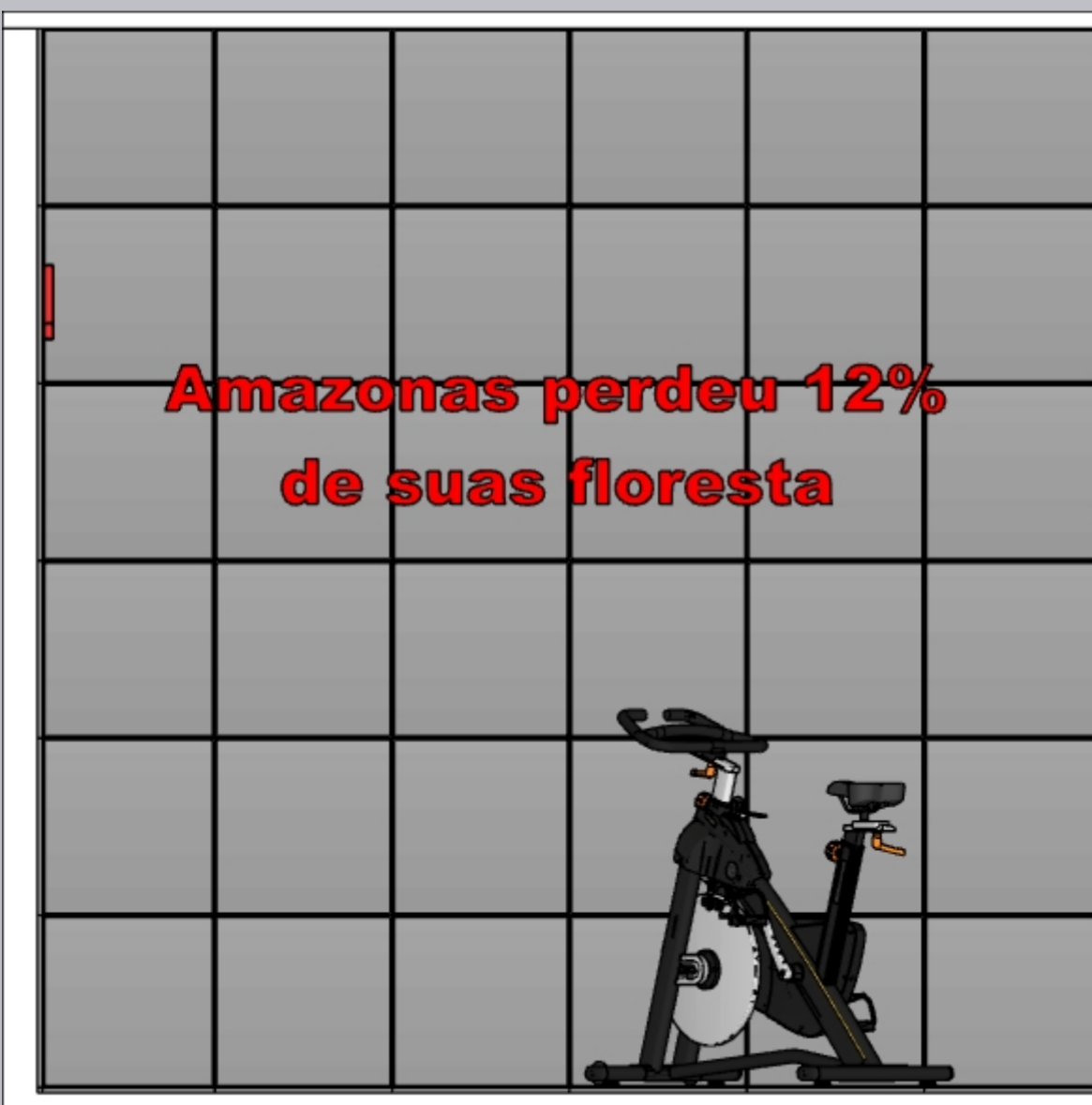
VISTA A ESCALA 1:20