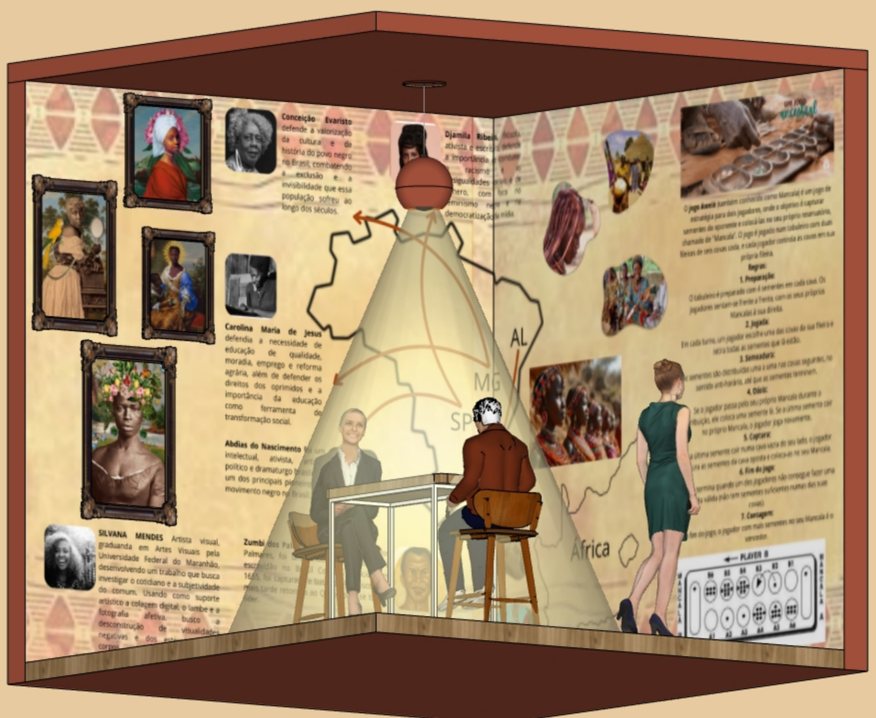
ISOMETRICO S/ ESCALA