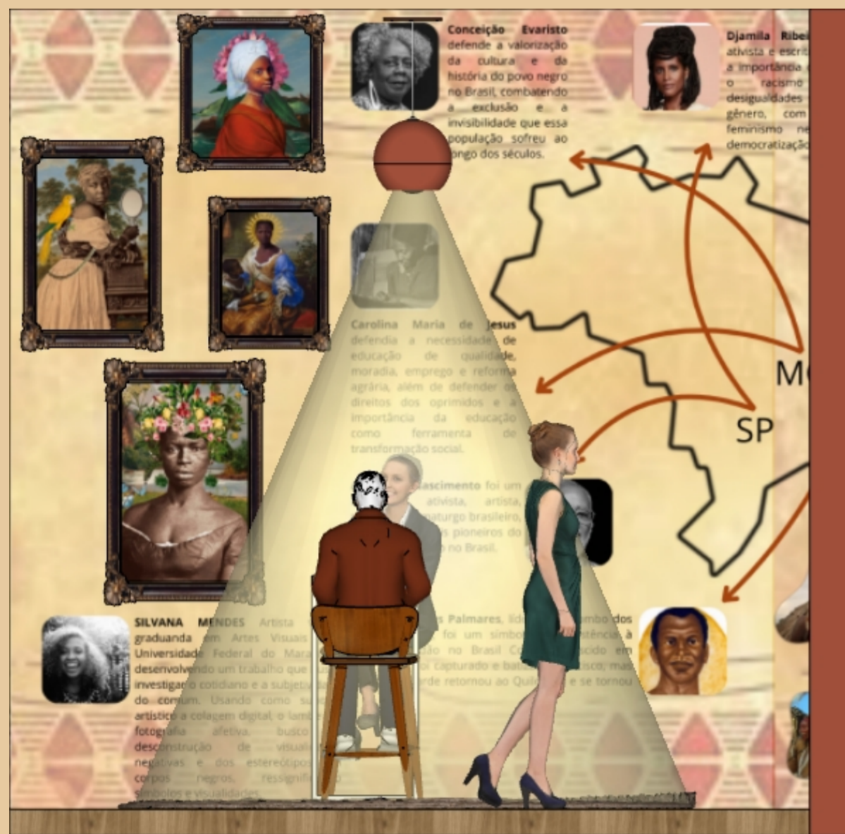
VISTA A ESCALA 1:20