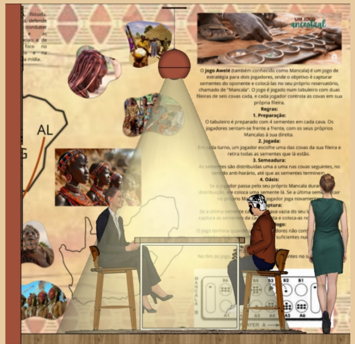
VISTA B ESCALA 1:20