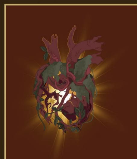
Vetorização do Coração simboliza a essência vital e a esperança