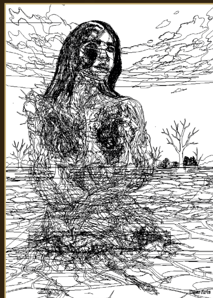
Modo de visualização em linhas no Adobe Illustrator