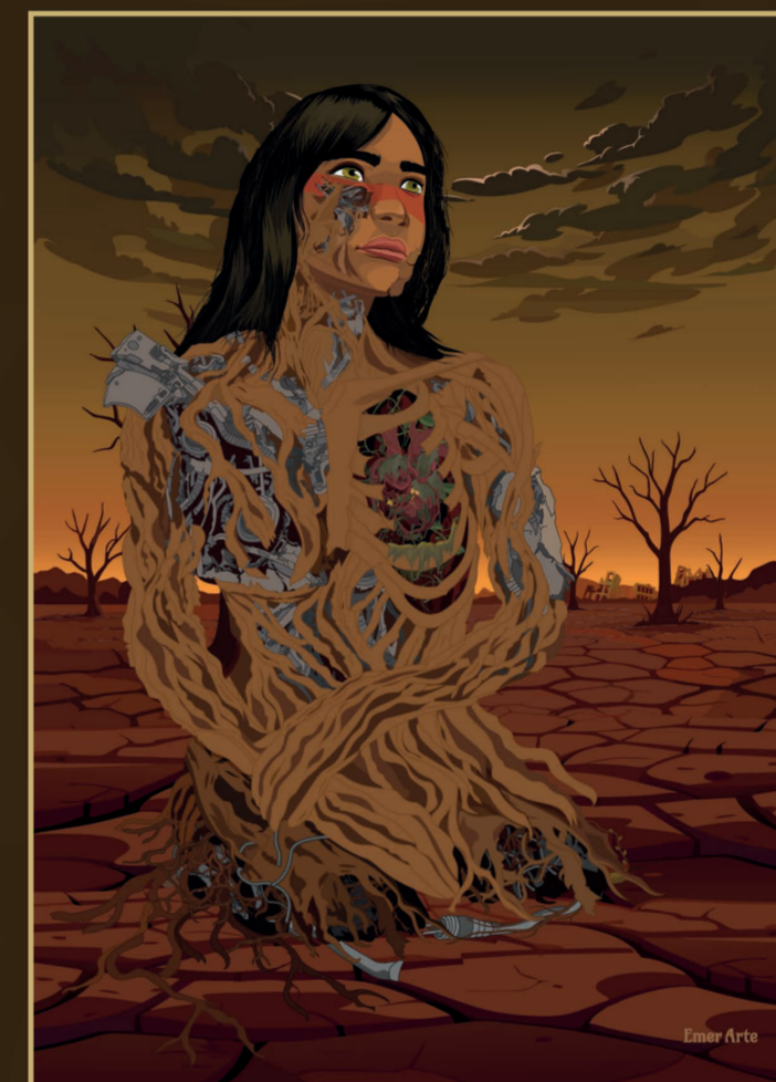
Cor Base (sem Luz e Sombra)