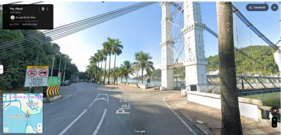
Visual real do local da pintura na era moderna.

Felizmente encontrei um único exemplar de pintura realista mais próxima que gostaria para a reimaginação da chegada em São Vicente, que seria o local da primeira chegada dos barcos, e inclusive ocorre a incensação anual neste mesmo braço de mar na Pintura de Benedito Calixto de Jesus em 1853.