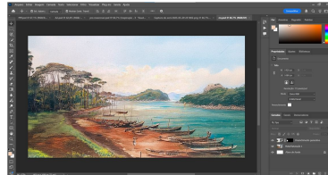
Imagem retratada para dar a ambientação de 1500