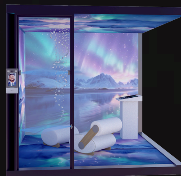
Vista Sem escala

VIVENZA — repensando o presente para construir futuros mais humanos.