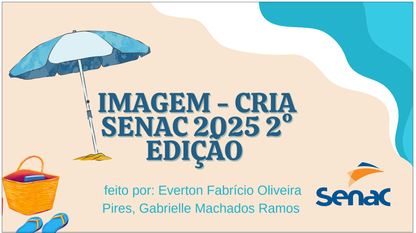
IMAGEM - CRIA SENAC 2025 2 o EDIÇÃO

feito por: Everton Fabrício Oliveira Pires, Gabrielle Machados Ramos