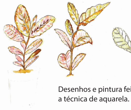
Desenhos e pintura feita à mão com a técnica de aquarela.